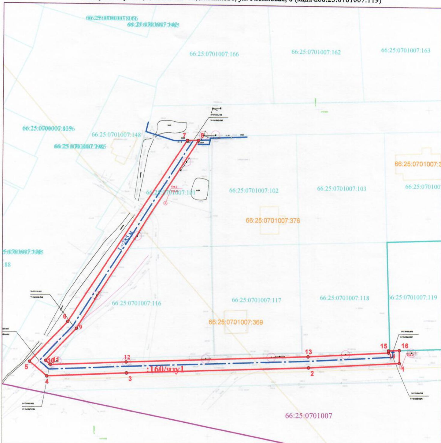
Схема границ предполагаемых к использованию земель или части земельного участка на кадастровом плане территории Объект: Газопровод-ввод до границы земельного участка по адресу: Свердловская обл., Сысертский район, д. Большое Седельниково, ул. Рябиновая, 8 (кад.№66:25:0701007:119)